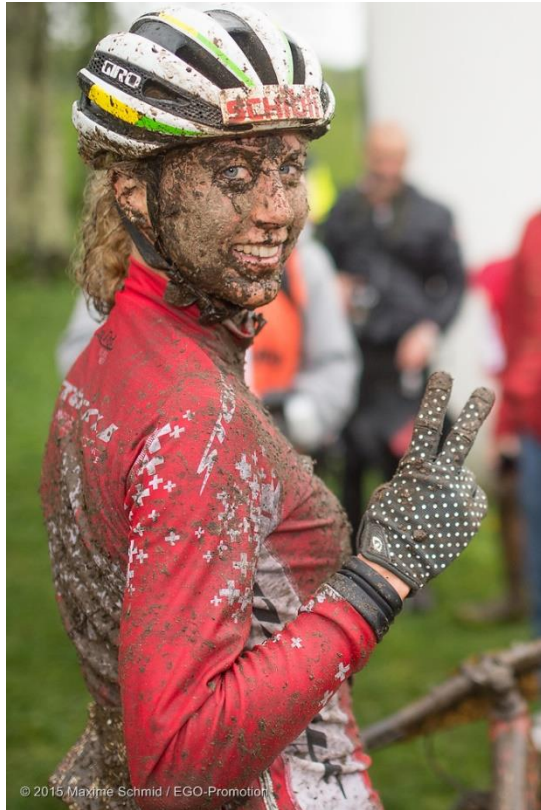
Jolanda Neff, Mountainbike