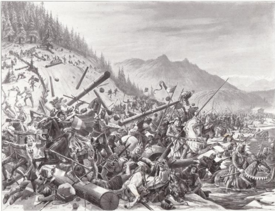
35. SCHLACHT AM MORGARTEN.