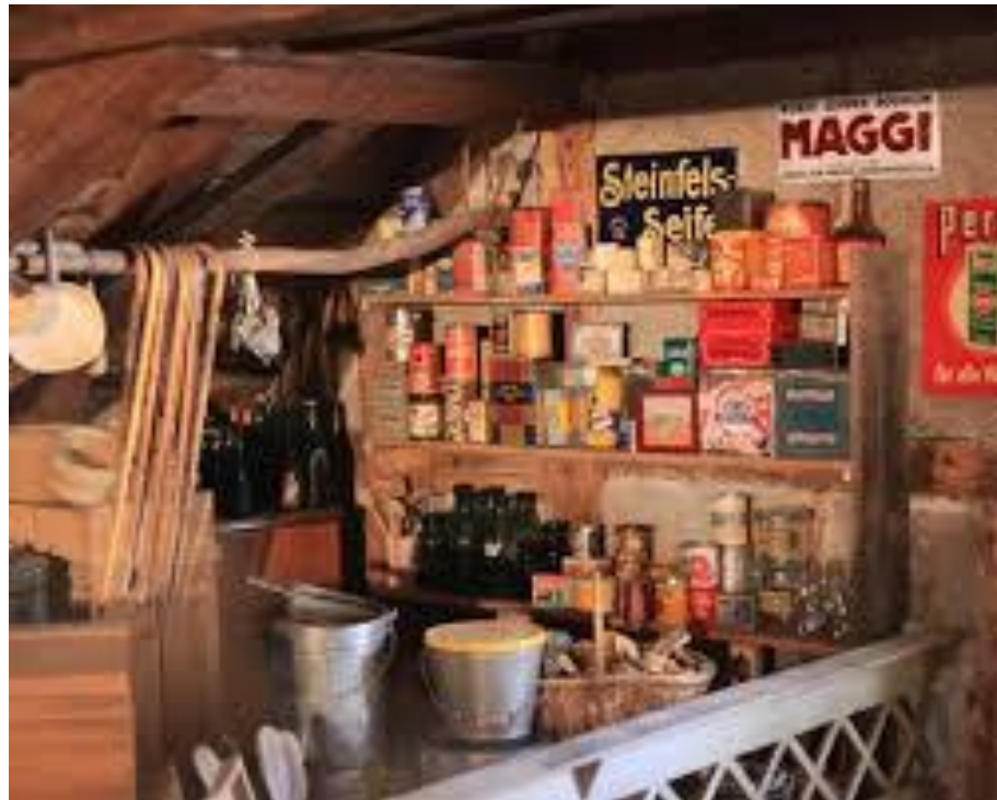
Alte Post im Weisstannental