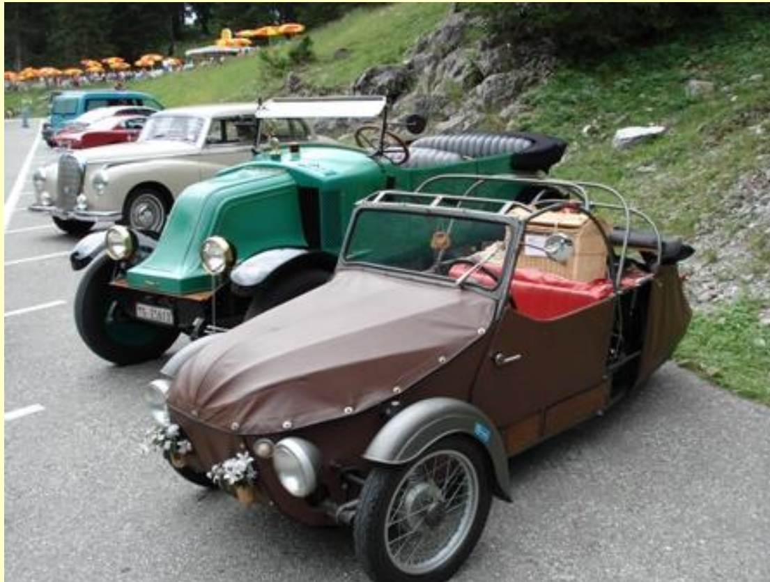
Volvos aus vergangenen Zeiten